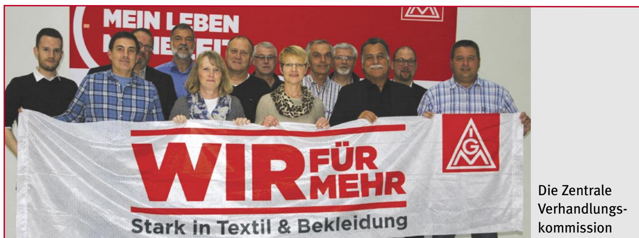
Die Zentrale Verhandlungs- kommission

Diese Forderung ist sozial gerecht und ökonomisch vertretbar. In den Betrieben nehmen die Arbeit und der Stress permanent zu. Der Umsatz steigt und gleichzeitig wird die unterste Beschäftigungslinie gefahren, die gerade noch vertretbar erscheint. Und das Ganze bei älter werdenden Belegschaften. Die anstehende Tarifrunde muss jetzt dazu genutzt werden die Einkommen in der Textil- und Bekleidungsindustrie nach oben zu bringen. Die Branchen müssen attraktiver werden für die Menschen, die jahraus und jahrein einen guten Job machen. Um Auszubildende zu gewinnen braucht man Perspektiven und gute Ausbildungsvergütungen. Die Beschäftigten und die Auszubildenden haben es verdient, WIR sind mehr Wert.