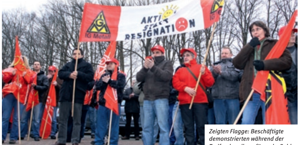
Zeigten Flagge: Beschäftigte demonstrierten während der Tarifverhandlung für mehr Geld.

Die Arbeitgeber hatten im Dezember zwei Tariferhöhungen von 1,8 und 1,9 Prozent angeboten. Das war für sie „das Äußerste“. Die IG Metall lehnte ab, sie forderte mehr. Die dritte Verhandlungsrunde begann deshalb sehr zäh. Nur langsam kamen sich die Tarifparteien näher, Schritt für Schritt. Erst nach vier Stunden war der Tarifpoker