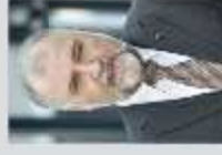
Klaus Wiesehügel (Bundesvorsitzender IG Bau), SPD