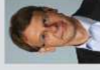
Markus Kurth (MdB) Bündnis 90/Die Grünen