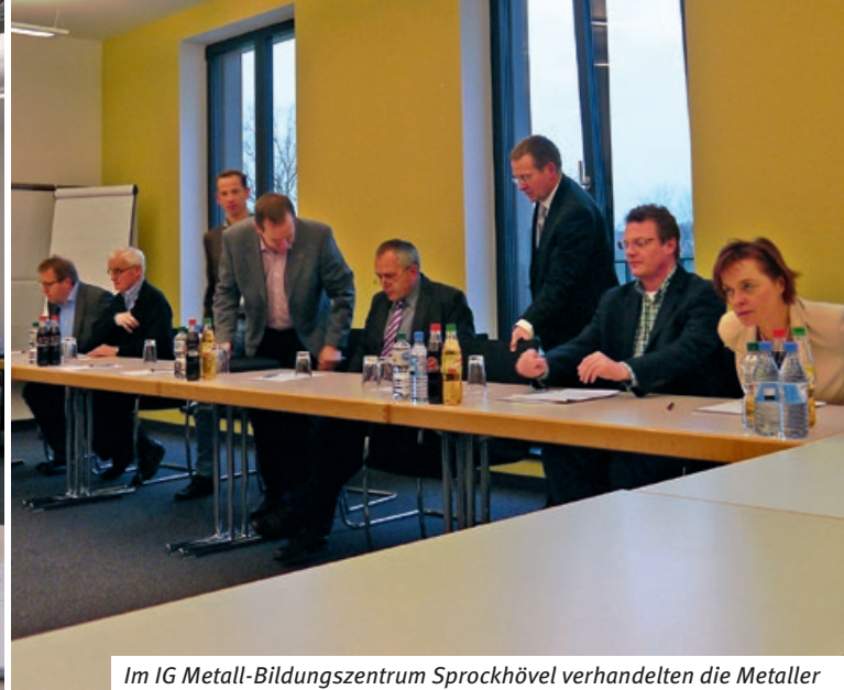
Im IG Metall-Bildungszentrum Sprockhövel verhandelten die Metaller (Foto links) mit den Vertretern des Arbeitgeberverbandes – und einigten sich in der dritten Tarifverhandlung am 17. Dezember.